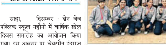
खेल प्रतियोगिता में भाग लेते विद्यार्थियों के साथ अध्यापक।

प्री नर्सरी से लेकर सभी कक्षाओं के विद्यार्थियों ने उत्साहपूर्वक खेल प्रतियोगिताओं में लिया भाग