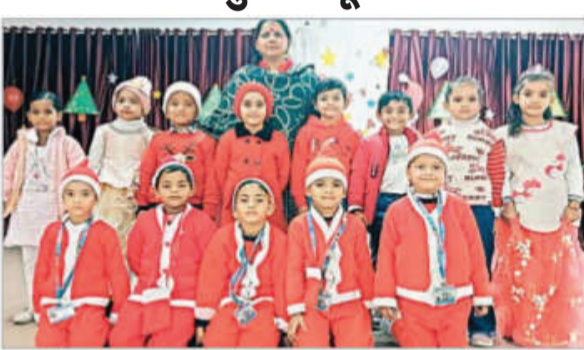
कार्यक्रम के दौरान प्रधानाचार्य के साथ विद्यार्थी।

कार्यक्रम में ईसा मसीह के जन्म से संबंधित और विश्व पूजिता तुलसी पर बच्चों ने दी स्पीच