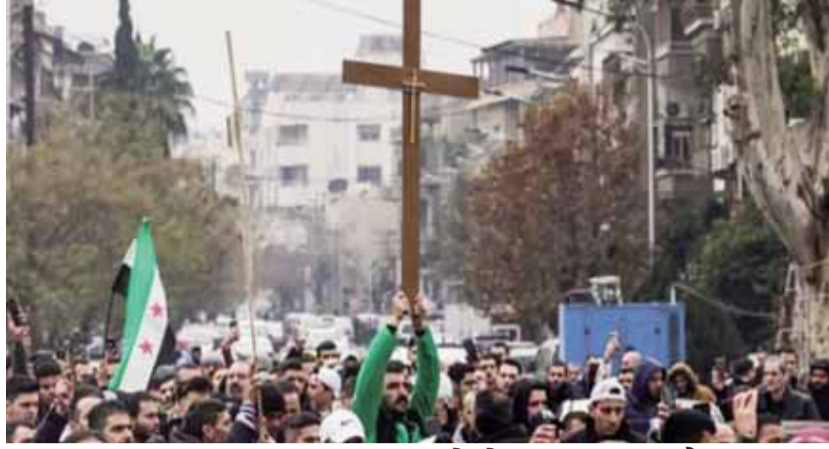
लगभग 500 श्रद्धालुओं के बीच क्रिसमस से पहले लोगों ने भजन गए, लोगों का कहना है कि उन्होंने कई सालों बाद राहत की सांस ली।

सीरिया में तख्तापलट के बाद ही पहला त्योहार क्रिसमस आया है। इस त्योहार से पहले ईसाई धर्म की चिंताएं भी बढ़ गई थीं। लोगों को डर था कि कट्टरपंथी संगठन के दमिश्क पर कब्जे के बाद क्रिसमस कैसे मनाएंगे। अब आपको बताते हैं वहां त्योहार के दौरान कैसा माहौल रहा। राजधानी में ईसाई समुदाय के लोगों ने जमकर विरोध प्रदर्शन किया। उनके बीच क्रिसमस ट्री को जलाए जाने को लेकर काफी आक्रोश रहा। वहीं दमिश्क के चर्च में