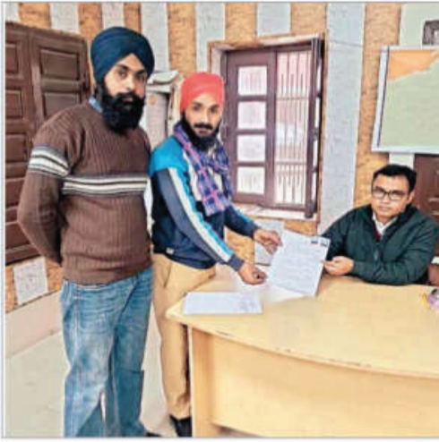
के साथ रहे जेल भी काटी लाठी चार्ज भी हुए अब झंडा गुप से टिकट लेने वालों में होड़ मची हुई है

झंडा गुप में सदस्य आजाद उम्मीदवार बनकर चुनाव मैदान में